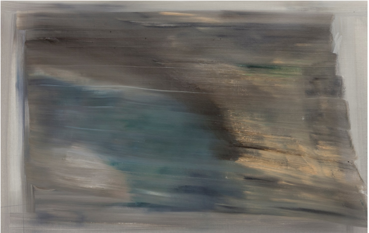
Ferito di guerra – olio su tela – 63x42 cm