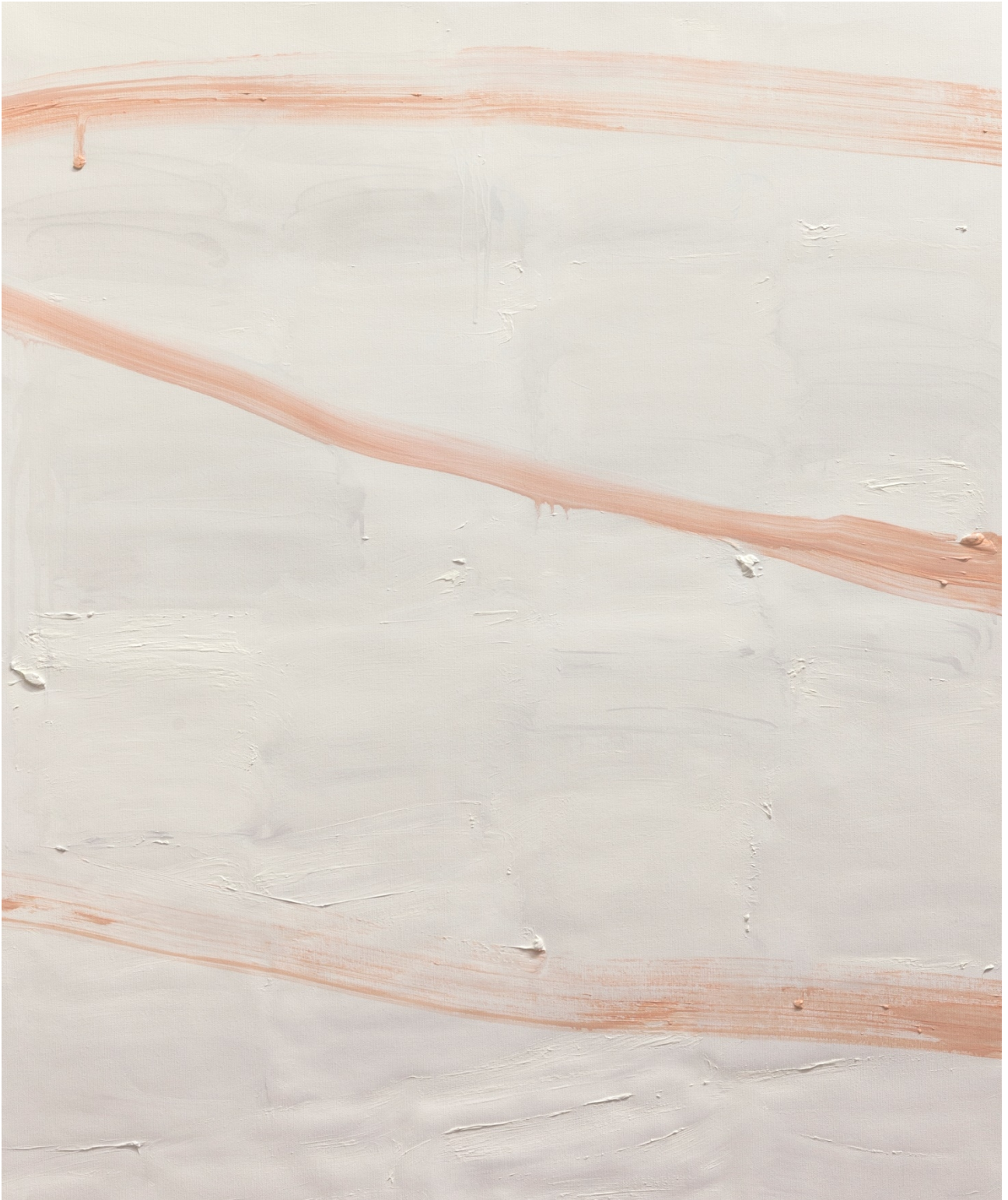
Un' idea di giustizia Variante – olio su tela – 94x78 cm