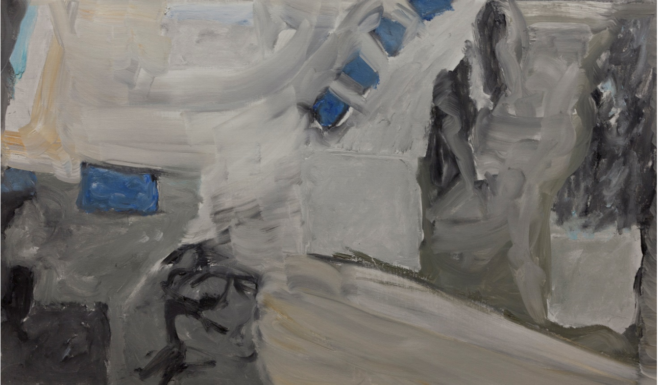
Un' aula di tribunale – olio su tela – 37x 90 cm