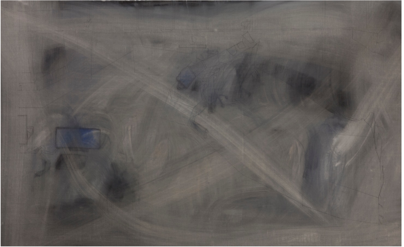
Un'aula di tribunale – olio su tela – 76x146 cm