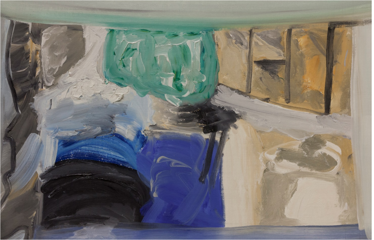
Stanza di un carcere – Olio su tela – 51x76 cm