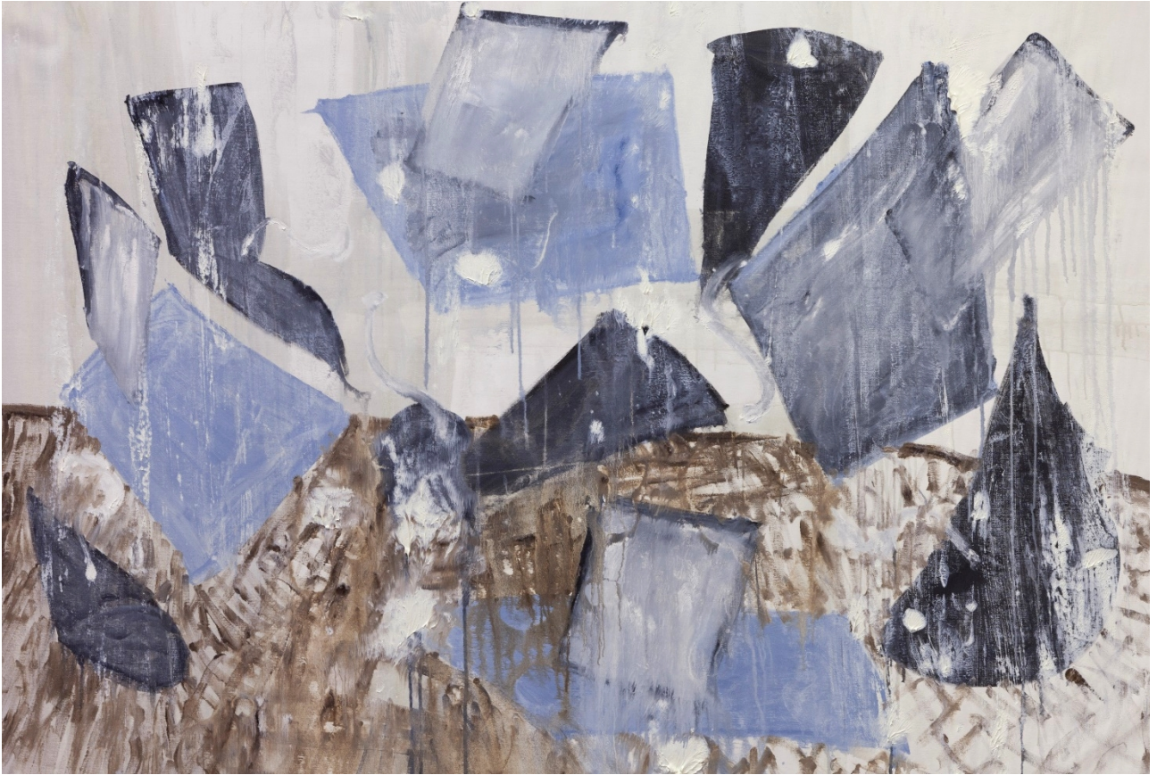
Un' aula di tribunale – olio su tela – 167x114 cm