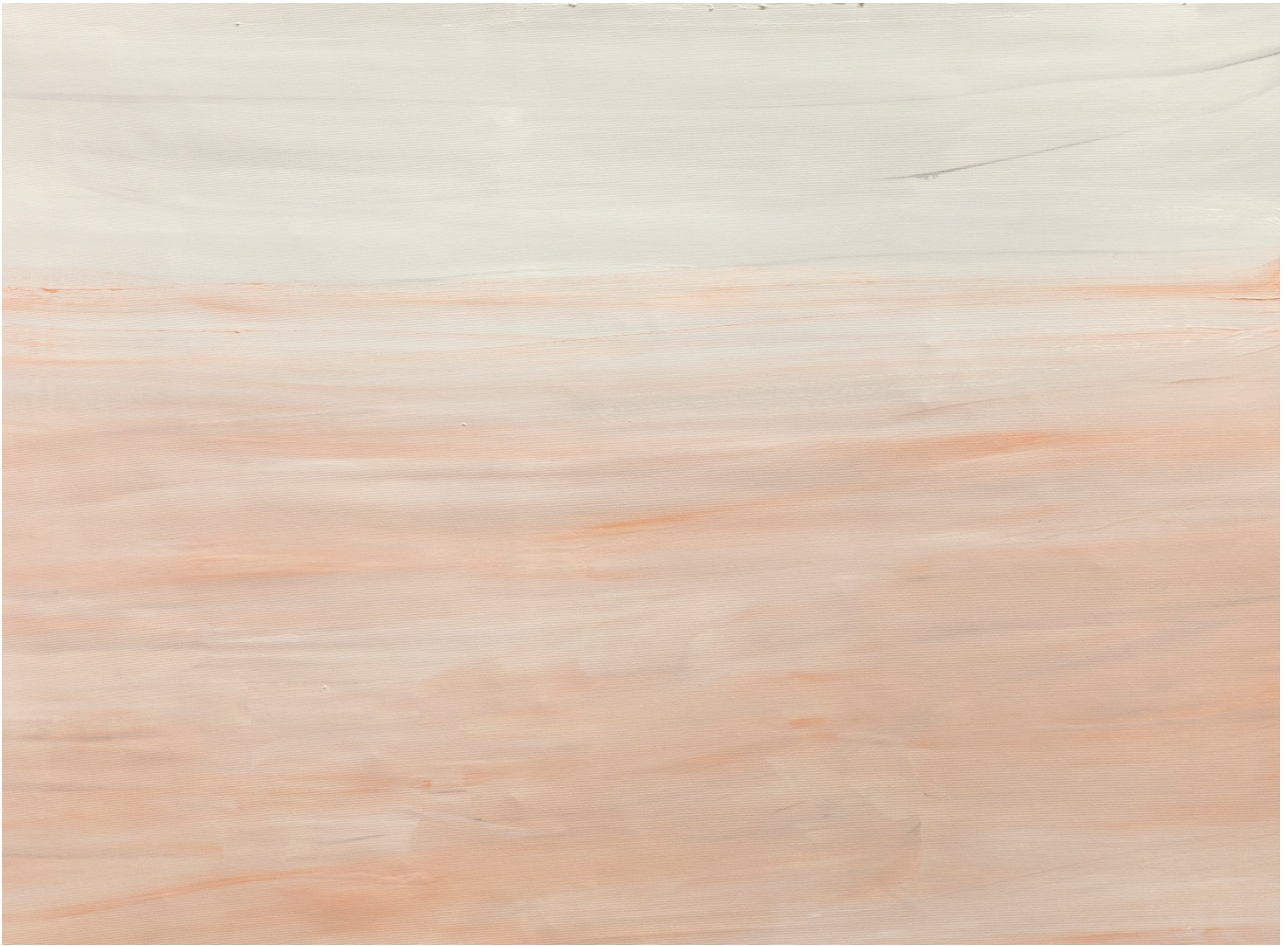
Un'idea di giustizia – olio su tela – 83x105 cm