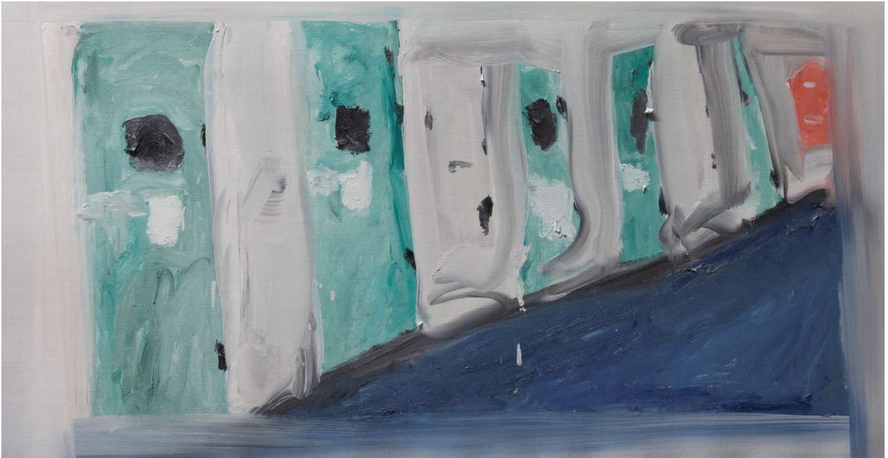
Corridoio di un carcere – olio su tela – 49x94 cm