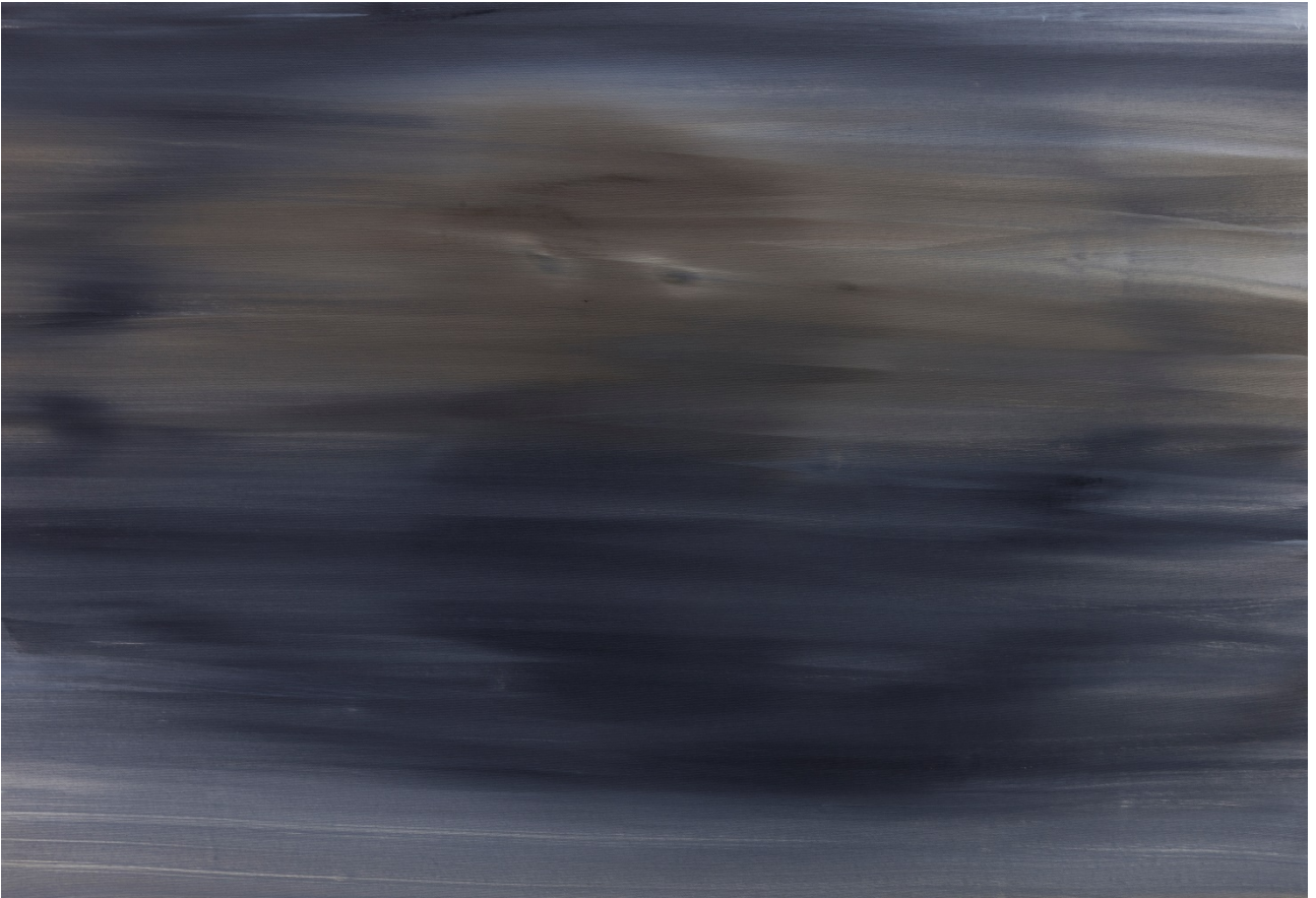
Un criminale di guerra – olio su tela – 79x116 cm