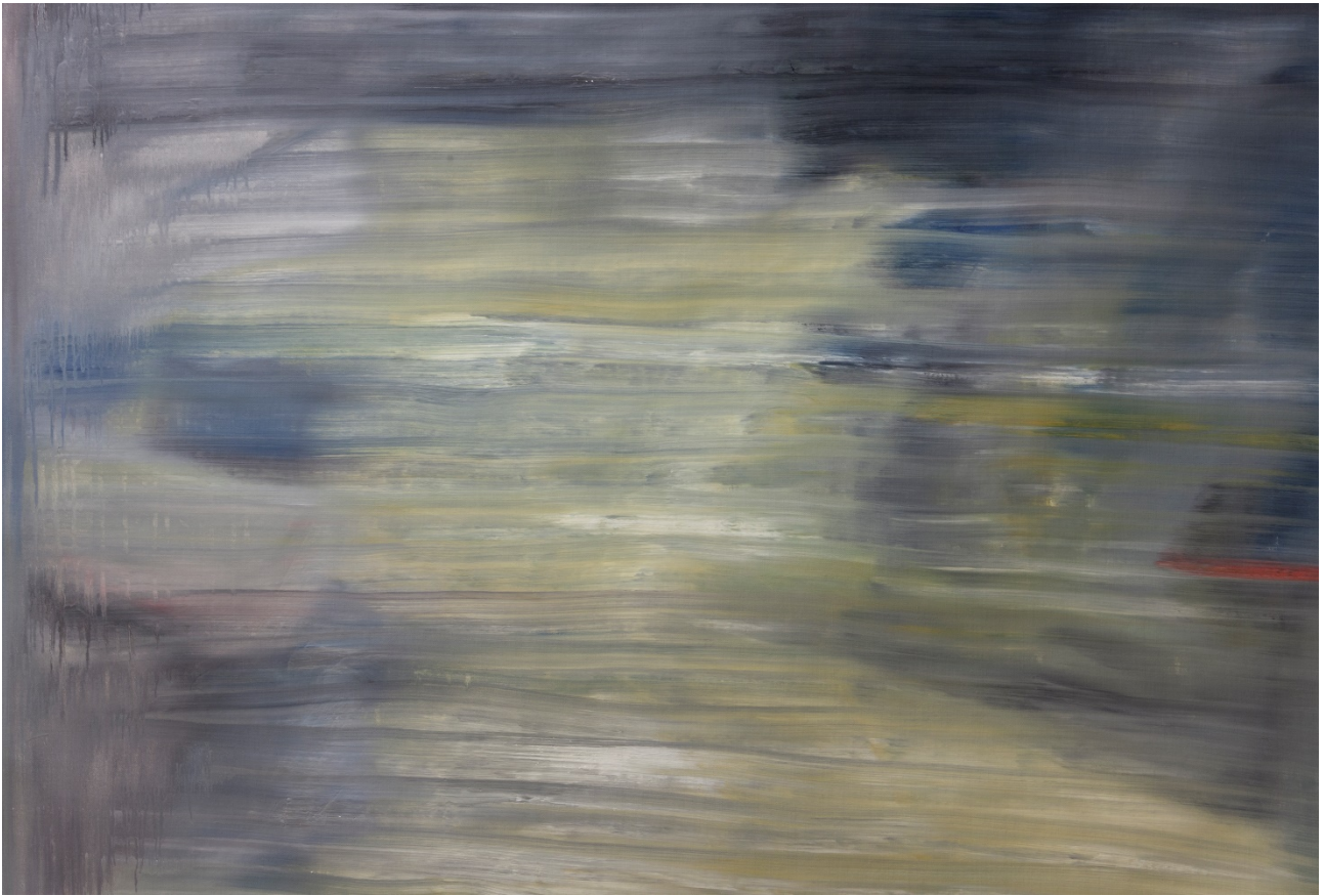
Un' aula di tribunale – olio su tela – 86x122 cm

(Foto delle tele prive di telai – da intelaiare)